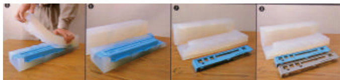
シリコン型からの脱型